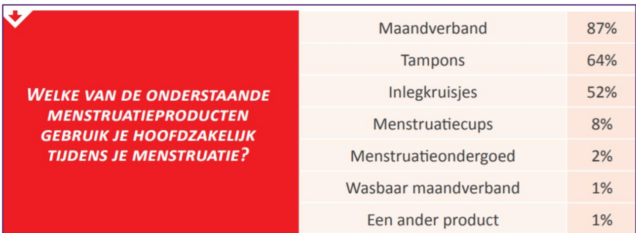
Figuur uit onderzoeksrapport “Dubbel Taboe”, Caritas, 2020, p. 21

Nu zien we ook voorbeelden in het onderzoek van meisjes die oneigenlijk gebruik maken van de pil (ze blijven doornemen) om zo het probleem van menstruatiearmoede te omzeilen, dit omdat de pil tot 25 jaar volledig terugbetaald is door de ziekteverzekering. Duurzame menstruatieproducten beschikbaar maken voor iedereen via de ziekteverzekering is gezondheidsbevorderend en zal de drempel aanzienlijk verlagen voor meisjes en vrouwen om ook de stap naar duurzame producten te durven zetten.